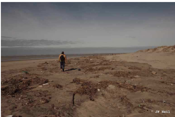
Laisse de mer, cordon dunaire de Bonne Anse, Les Mathes (2 mars 2014)

L'article de Hervé THOMAS n'est pas un simple inventaire, une méthode d'évaluation et un constat. Il donne des informations de base pour comprendre le fonctionnement et la spécificité de la biologie des plages(2). Bien que familiers, ces milieux restent, en effet, pour la plupart d'entre nous, une terra incognita .