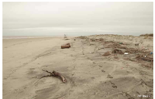
Laisse de mer, cordon dunaire de Bonne Anse, Les Mathes (2 mars 2014)