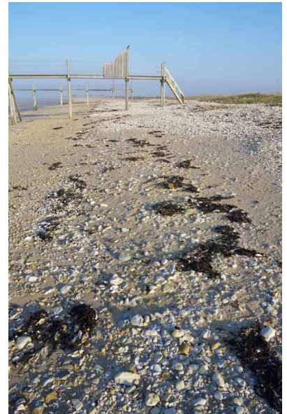
Laisse de mer à Yves (décembre 2013)

Habitué au nettoyage estival des plages nous avons souvent l'impression que ces lieux sont un désert animal. Pourtant une faune adaptée y survit à la condition qu'elles ne soient pas ou peu soumises à l'érosion ou aux pratiques de nettoyage et de criblage liées aux impératifs de l'esthétique balnéaire. En effet cette population marginale fragile dépend notamment d'une aumône marine : les laisses de mer et bois flottés. Exceptions faites des déchets anthropiques et des sinistres « marées vertes » qui parfois les polluent, ces dépôts abandonnés à chaque marée, à chaque tempête, sont des milieux de vie précieux pour les écosystèmes côtiers et non des déchets qui « salissent » nos plages.